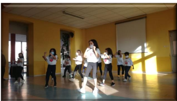
Spectacle de Noël (mercredi 16 décembre)

En cette année exceptionnelle, le carnaval a pu se dérouler normalement, juste avant le premier confinement, sur le thème de « La planète ». Les enfants ont défilé, dansé, fait du bruit, mais avec une démarche écologique mieux pensée qu'habituellement (moins de véhicules, de déchets de goûter, confettis biodégradables, etc.)