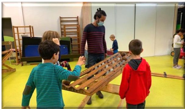
Fête du Jeu (mercredi 14 octobre)

Elles regroupent traditionnellement les enfants des 4 maisons de l'enfance, mais aussi de plusieurs autres centres de loisirs de l'agglomération.