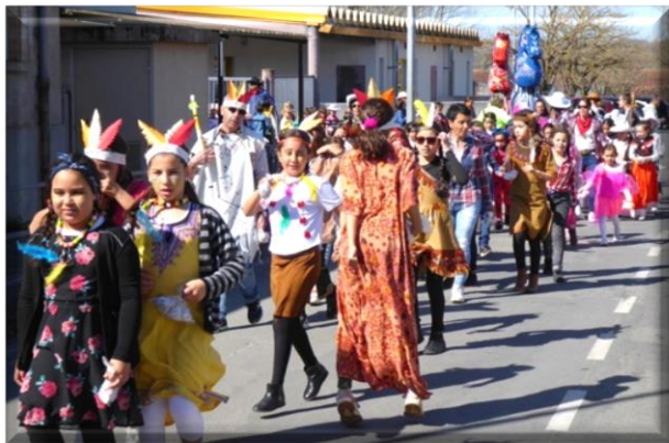
Carnaval dans les rues de Graulhet (mercredi 11 Mars)

Les journées communes ont lieu une fois par trimestre. Chaque maison de l'enfance supervise l'organisation de l'une de ces journées